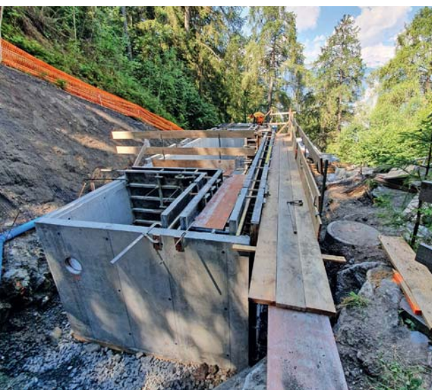
Construction du dépotoir des Pirys.

Nos glaciers reculent presque à vue d'œil, le permafrost dégèle toujours plus profondément, l'eau va indéniablement devenir plus rare. Il est temps de l'économiser, de rationaliser son utilisation.