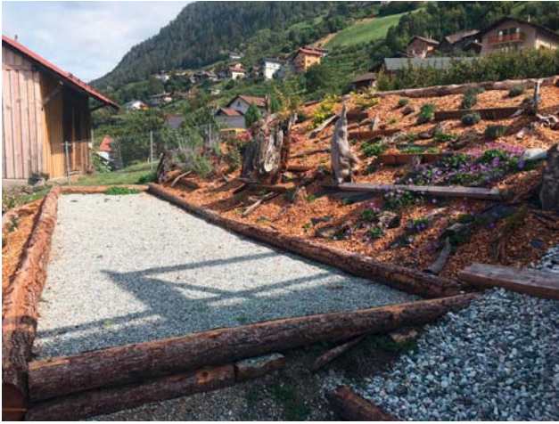
Place de jeux à Fey.