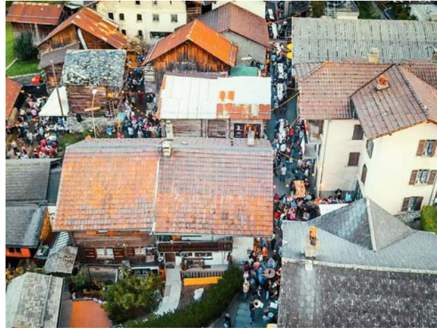
Le cavœuvœu de Basse-Nendaz.