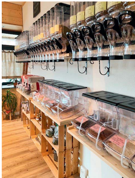
« O byô local » à Haute-Nendaz.

La commune de Nendaz a obtenu le label 3 étoiles en 2011, renouvelé une première fois en 2015 avec 39 mesures et une 2ème fois en 2019 avec 54 mesures.